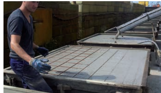
Production de dalles en béton

La norme n'est pas obligatoire pour les produits en béton, qui sont régis par d'autres normes.