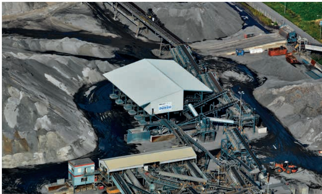
L'usine de traitement néerlandaise REMEX, exploitée par sa filiale HEROS Sluiskil B.V.

conformément à la réglementation néerlandaise. Le matériau final est normé CE, certifié KOMO® et commercialisé sous la marque granova®. En plus d'être une alternative durable et financièrement attrayante aux matériaux primaires, granova® apporte également un réel avantage concurrentiel aux fabricants de béton.